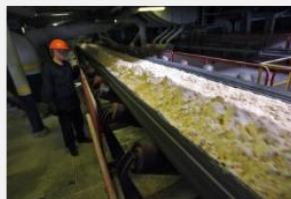
Расширение производства глинозема