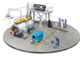
Реконструкция котельного оборудования